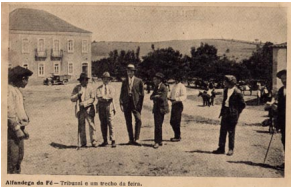
Alfândega da Fé - Tribunal e um trecho da Praça.

Na primeira foto, do lado esquerdo, vê-se em primeiro plano um edifício que na altura servia apenas de Tribunal. Depois de ser ampliado já nos anos 30, passou a ser a Câmara Municipal, embora o Tribunal ali se mantivesse, como ainda hoje acontece. Do mesmo lado, em segundo plano, vê-se um outro edifício, conhecido por "Casa Grande".